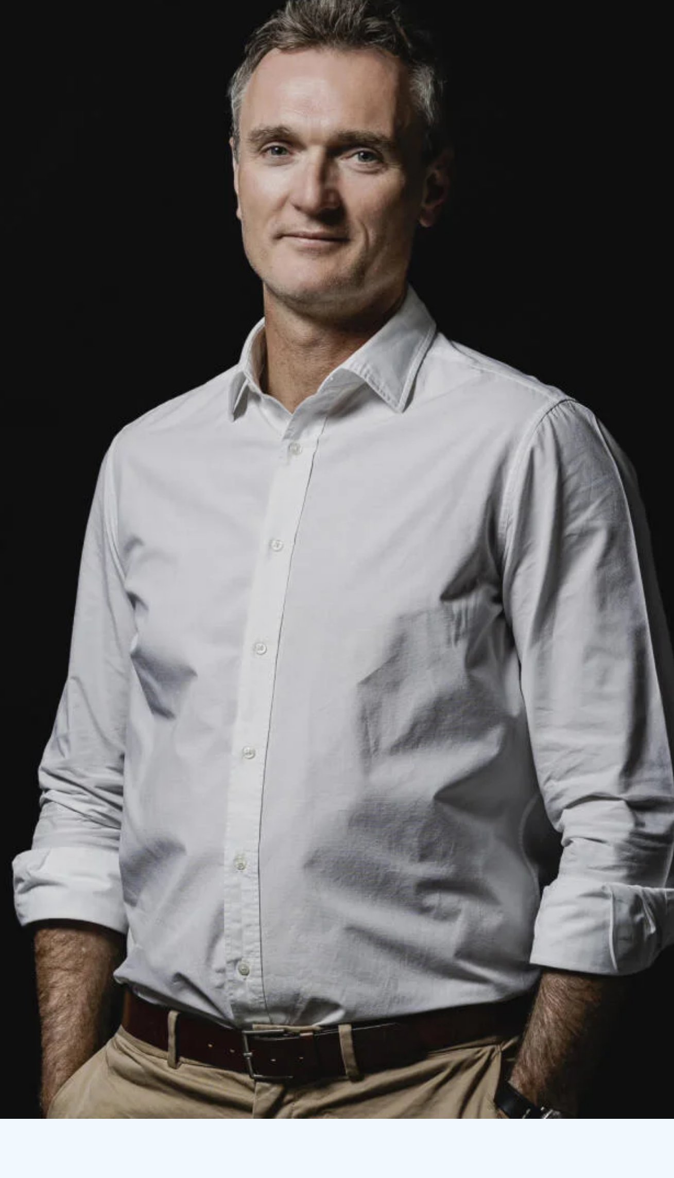
Zdroj: MICHAL ŠMÍČEK